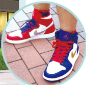
AIR JORDAN 1 RETRO HIGH "RIO OLYMPIC MEDAL"

右マシコ氏。左勇氣氏。 アウトレットに精通する2 人らしく、取材料の足元 にはいずれもアウトレット で購入したAJ1が選ばれ ていた。