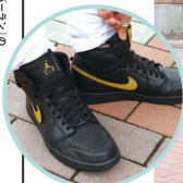
AIR JORDAN 1 RETRO HIGH "BHM 2017"

青春オーバーランの マシコです! アウトレットハンターの 名にかけて 勝ちに行きます!