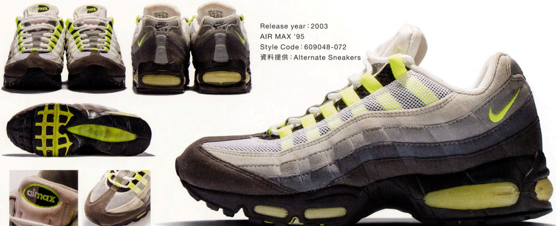
Release year : 2003 AIR MAX '95 Style Code : 609048-072

2003年に復刻した“イエローグラデ”では、アウトソールに装着されるパーツから気圧表示が消滅し、中央にスウッシュロゴが入るだけのシンプルなデザインに変更された。このシンプルデザイン版のパーツは、基本的に“OG”と呼ばれる復刻モデル以外の全てに受け継がれているディテールだ。さらにシュータンの“air max ロゴ”の地色が反転され、向かって左がシルバー、右がブラックとなっている。今思えば文字色のネオンイエローを引き立てるためのアップデートだと考えられるが、当時は「印象が変わってしまった」とネガティブに受け取るファンが少なくなかったようだ。